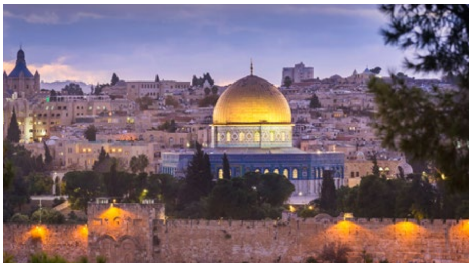
Der Felsendom, Jerusalem, Israel