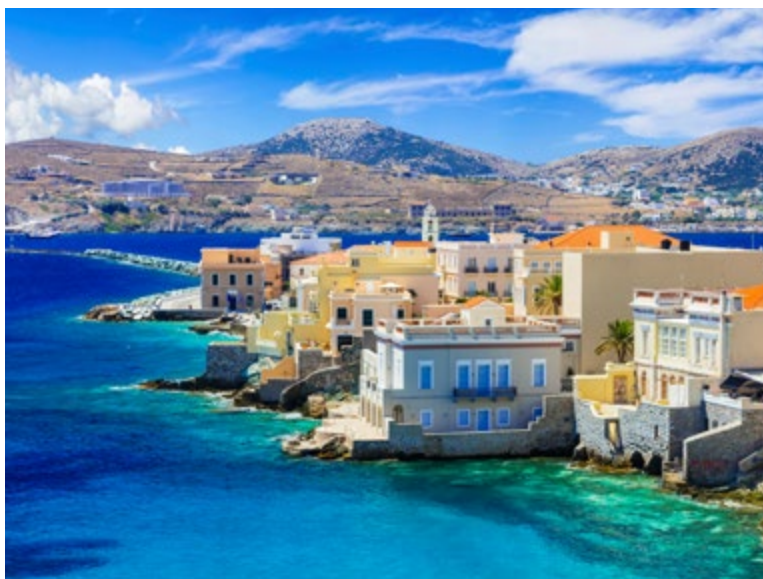
Hafen von Heraklion mit dem alten venezianischen Fort Koule, Kreta, Griechenland

Silversea freut sich, die Wiederaufnahme unserer Kreuzfahrten ab dem 18. Juni 2021 anzukündigen. Seien Sie unter den Ersten, die unsere neuen Reisen auf einem der geräumigsten Schiffe unserer Flotte genießen. Reisen Sie an Bord unseres neuesten Flaggschiffs Silver Moon zu den wunderschönen griechischen Inseln, auf massgeschneiderten Reiserouten, die das Beste einer Region bieten. Plus, dank zwei alternativer Reiserouten, die jeweils unterschiedliche Ziele im östlichen Mittelmeer ansteuern, haben Sie sogar die Möglichkeit, diese Reisen für eine ausgedehnte Erkundung zu kombinieren. Von sonnengeküssten Stränden bis hin zu UNESCO-Weltkulturerbestätten haben wir diese Kollektion von Kreuzfahrten unter Berücksichtigung aller Sicherheitsmassnahmen konzipiert. So können Sie die authentische Schönheit der Welt in unerschütterlichem Vertrauen entdecken.